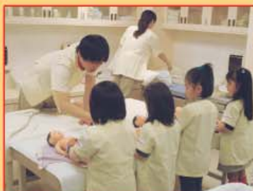
การศึกษาดูงานประเทศญี่ปุ่น วันที่ 2-7 มีนาคม 2551

ด้วยความตระหนักในการพัฒนาตนเองของผู้บริหารโรงเรียนเทพมิตรศึกษาที่เล็งเห็นความสำคัญที่จะปรับรูปแบบ พัฒนาการบริหารจัดการให้มีประสิทธิภาพมากยิ่งขึ้น ดังนั้นผู้บริหารจึงเข้ารับการอบรม สัมมนาศึกษาดูงานทั้งในและต่างประเทศ เพื่อศึกษา และนำความรู้ต่างๆ มาเป็นแนวทางในการพัฒนาให้โรงเรียนเทพมิตรศึกษาบรรลุตามนโยบาย และเป้าหมาย เพื่อให้นักเรียนนั้นได้ตามแบบอย่างของปรัชญาของโรงเรียนที่ว่า "ความรู้ คู่คุณธรรม นำสังคม"